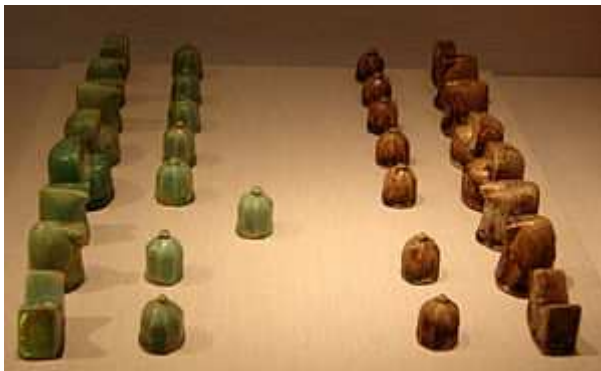
Piezas de Shatranj

La expansión hacia el occidente del ajedrez se debe a los musulmanes. La conquista de la India no se inicia hasta la segunda mitad del siglo VIII, aunque para entonces el ajedrez ya se había conquistado a partir del 640. La primera mención expresa al ajedrez en un texto persa del 600. La influencia persa se rastrea en algunas palabras como «alfil», que deriva de la palabra árabe « al-fil », ‘elefante’, que era lo que antiguamente representaba. La expresión «dar jaque», amenazar al rey, viene de Sha, rey de los persas y Sha mat significa «el rey ha muerto».